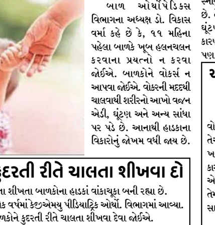
બાળકોને કુદરતી રીતે ચાલતા શીખવા દો વોકરની મદદથી ચાલતા શીખતા બાળકોના હાડકાં વાંકાચૂકા બની રહ્યા છે. આવા ઘણા બાળકો એક વર્ષમાં કેટલુંએમયુ પીડિયાટ્રિક ઓર્થો. વિભાગમાં આવ્યા. ડોક્ટરોની સલાહ, બાળકોને કુદરતી રીતે ચાલતા શીખવા દેવા જોઈએ.

લખનઉ, તા. ૨૭ બેબી વોકર શિશુઓના પગના હાડકા અને સ્નાયુઓને નબળા બનાવે છે. આ વાતનો ખુલાસો કરતી વખતે, KGMUના ડોક્ટરોએ સલાહ આપી કે, બાળકોને કુદરતી રીતે ચાલતા શીખવવું જોઈએ. કે જુએ મયુના પીડિયાટ્રિક ઓર્થોપેડિક્સ વિભાગની દરેક ઓપીડીમાં દરરોજ ૧૦૦ થી ૧૨૫ બાળકો હાડકાને લગતા રોગો સાથે આવે છે. એક વર્ષમાં આવા ૨૦ હજારથી વધુ બાળકો ઓપીડીમાં આવે છે. ઘણા બાળકો તેમની રાહ અને ઘૂંટણમાં સમસ્યાનો સામનો કરી રહ્યા છે. તબીબોના મતે જ થી આઠ મહિનાના બાળકોમાં એડી સંબંધિત સમસ્યાઓનું કારણ વોકર હોવાનું જણાયું છે.