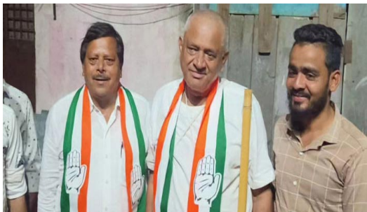
કોંગ્રેસ નેતાના વિવાદી નિવેદનથી અનેક સવાલો ઉભા થયા છે. કોંગ્રેસ નેતાઓ સાથે મોદીની વાતચીત.