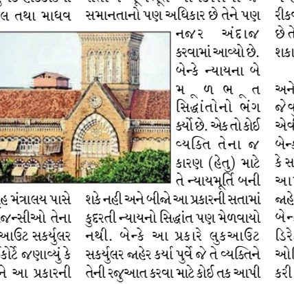
સત્તાએ મૂળભૂત અધિકારોમાં જે સમાનતાનો પણ અધિકાર છે તેને પણ નબર અંદાજ કરવામાં આવ્યો છે. બેન્કે ન્યાયના બે મૂળભૂત સિદ્ધાંતોનો ભંગ કર્યો છે. એક તો કોઈ વ્યક્તિ તેના જ ચકાદો આપ્યો છે. સામાન્ય રીતે આ પ્રકારની સત્તા કેન્દ્રીય ગૃહ મંત્રાલય પાસે જ છે અને વિવિધ એજન્સીઓ તેના હેઠળ આ પ્રકારની લુકઆઉટ સર્કયુલર બહાર કરી શકે છે. હાઈકોર્ટે જણાવ્યું કે બેન્કના અધિકારીઓને આ પ્રકારની

મુંબઈ: ચિરાણના કિફોલ્ટર સામે પગલા લેવામાં હવે બેન્કોને પણ બાકીદાર વિદેશ નાસી જાય નહી તે હેતુથી લુકઆઉટ સર્કયુલર બહાર કરવાની કેન્દ્ર સરકારે આપેલી સત્તા પર મુંબઈ હાઈકોર્ટ પ્રથમ ઉદાવતા સીધો પ્રથમ પુછ્યો હતો કે બેન્ક જ ન્યાયમૂર્તિ અને બેન્ક જ આદેશનો અમલ કરનાર બની રહી છે. હાઈકોર્ટે બેન્કોને લુકઆઉટ સર્કયુલર આપવાથી બેન્કોની સત્તાને રદ કરી હતી અને તેથી જણાવ્યું હતું કે બંધારણની કલમ ૨૧ મુજબ દેશના નાગરિકોને જે વ્યક્તિગત સ્વતંત્રતા અને વિદેશ પ્રવાસનો જ હક્ક આપ્યો છે તે ફક્ત એક અમલદારી આદેશથી