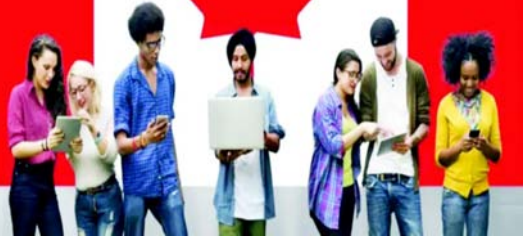
વડાપ્રધાન જસ્ટીન ટ્રુડોની વિખરલ પાર્ટીની સરકારે દેશમાં કામદારોની કમીને પુરી કરવા માટે કોવિડ-૧૯ મહામારી દરમિયાન આંતરરાષ્ટ્રીય છાત્રો માટે કામના

ટોરંટો (કેનેડા) તા.૧ કેનેડામાં ભારતીય સહિત અન્ય આંતરરાષ્ટ્રીય વિદ્યાર્થીઓને આર્થિક નુકસાનોનો સામનો કરવો પડી શકે છે. કેનેડા સરકારે તેમના ભણતરની સાથે સાથે થતી કમાણી પર કાતર ફેરવી દીધી છે. મતલબ કે કેમ્પસમાં અભ્યાસ બાદ કામ કરવાના કલાકોમાં ઘટાડો કરી નાખ્યો છે. કેનેડાના નવા નિયમો મુજબ હવે સપ્ટેમ્બર મહિનાથી દર સપ્તાહ ૨૪ કલાક જ પરિસ્સરની બહાર કામ કરવા માટે મળશે.