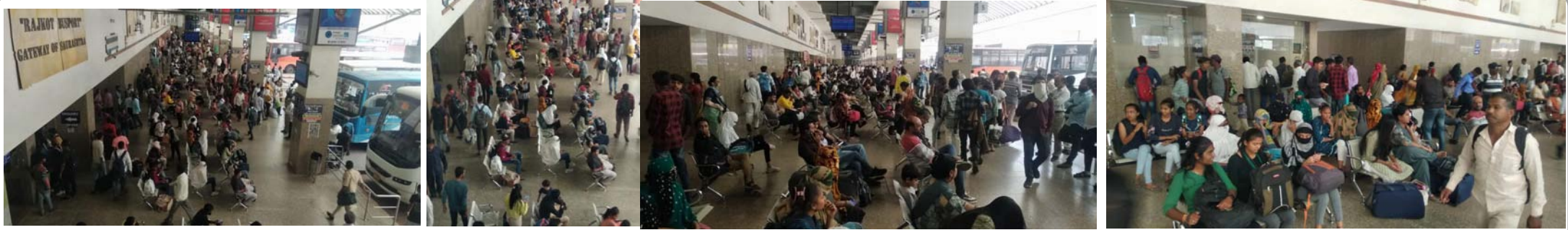
રાજકોટ એસ.ટી. બસપોર્ટ ઉપર છેલ્લા એક સપ્તાહથી વેકેશન અને લગ્નગાળાની બેરદાર અસર દેખાવા લાગી છે. અને બસ સ્ટેન્ડ ઉપર મુસાફરો ભારે ધસારો નહરે પડી રહ્યો છે. ત્યારની તસ્વીરો.