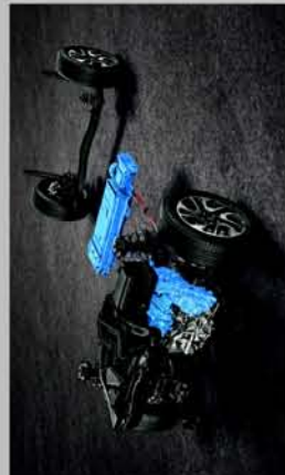
INTELLIGENT ELECTRIC HYBRID*