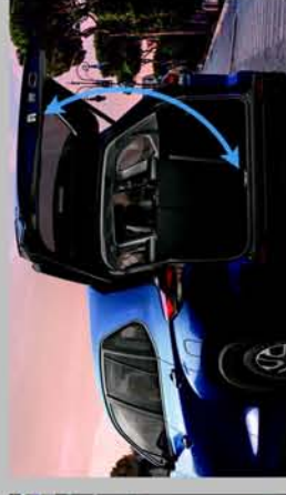
ONE-TOUCH POWERED TAIL GATE