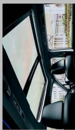
PANORAMIC SUNROOF WITH AMBIENT LIGHTS