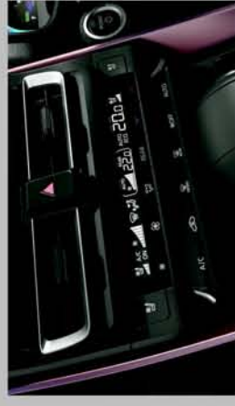
MULTI-ZONE CLIMATE CONTROL (FRONT AND REAR)