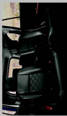
2 ND ROW CAPTAIN SEATS