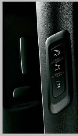
POWERED DRIVER SEAT WITH MEMORY FUNCTION