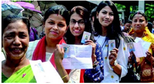
થયો છે જ્યાં ફાઇનલ ટકાવારીમાં ૪.૨ ટકા મતદાન વધી ગયું હતું. મતની

આંધ્રપ્રદેશ, આસામ, કર્ણાટક, મહારાષ્ટ્ર જેવા રાજ્યોમાં વધુ માત્રામાં મતોનો વધારો, હિન્દી બેલ્ટના રાજ્યોમાં સંખ્યા પ્રમાણમાં ઓછી વધી