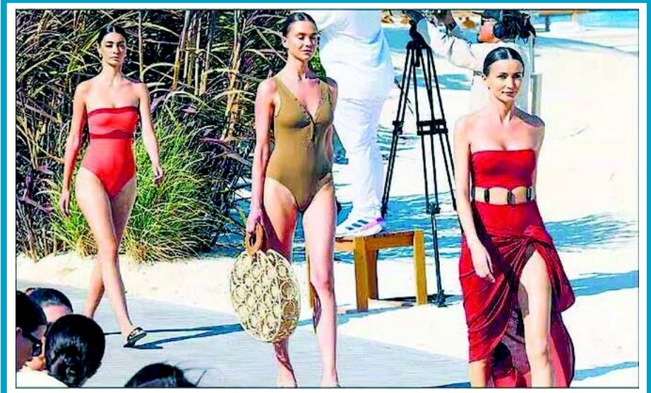
સાઉદી અરેબિયામાં પ્રથમવાર સ્વીમવીયર ફેશન શો ફૂટીચુસ્ત ગણાતા સાઉદી અરેબિયામાં પ્રથમ વખત સ્વીમવીયર ફેશન શો યોજવામાં આવ્યો હતો. એક આલીશાન રીસોર્ટમાં આ યોજાયેલા ફેશન શોમાં સ્વીમશુટ પહેરેલી યુવતીઓ રેમ્પ પર ઉતરી હતી. રીયલ એસ્ટેટ કંપની રેડ-સી ગ્લોબલનો આ રીસોર્ટ સાઉદી કાઉન્ટ્રી ક્લબ ડિવિઝન મોહમ્મદ બીન સલમાનનો છે.

ગર્ભિણ સર્વિસની શરૂઆત પણ ખૂબ જ જલદી શરૂ થશે. યુટીલીટી બેઝડ સર્વિસને લઈને પણ આમ જ કરવામાં આવી શકે છે.