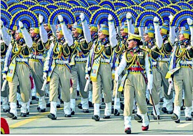
ગુરુવારે પ્રજાસત્તાક દિવસની પરેડના ફુલ ડ્રેસ રીહર્સલ દરમિયાન માર્ચ પાર્ટ કરતી સેન્ટ્રલ રિઝર્વ પોલીસ ફોર્સની મહિલા ટુકડી.

ડીઆરડીઓ સહિત ત્રણેય સેનાઓએ ગુરુવારે ફુલ ડ્રેસ રીહર્સલ કર્યું