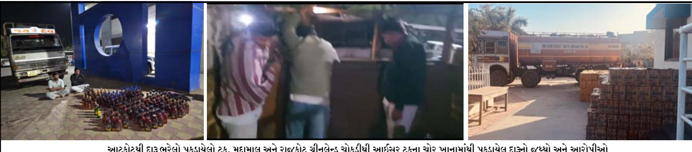
આટકોટથી દાડ ભરેલો પકડાયેલો ટ્રક, મુદ્દામાલ અને રાજકોટ ગ્રીનલેન્ડ ચોકડીથી આઈસર ટ્રકના ચોર ખાનામાંથી પકડાયેલ દાડનો બચ્ચો અને આરોપીઓ