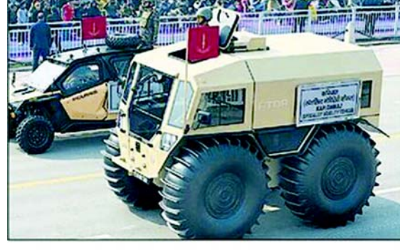
ફુલ ડ્રેસ રીહર્સલ દરમિયાન ડ્યુટી પથ પર જઈ રહેલાં કપિલ્લવજ સ્પેશિયાલિસ્ટ મોબિલિટી વ્હીકલ