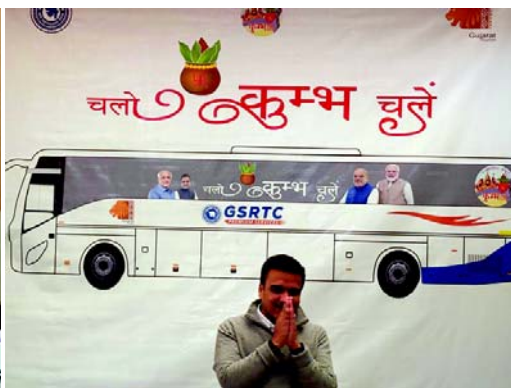
મુખ્યમંત્રી ભૂપેન્દ્ર પટેલ અને વાહનવ્યવહાર મંત્રી હર્ષ સંઘવીએ સંયુક્ત રીતે એક સકારાત્મક નિર્ણય લીધો છે. જે અંતર્ગત રાજ્ય સરકાર દ્વારા ગુજરાતથી દરરોજ એસી વોલ્વો બસ પ્રયાગરાજ ઉપડવાનો નિર્ણય લઈ શ્રદ્ધાળુને રાત્રી રોકાણ અને બસ મુસાફરી સાથેનું ઇકોનોમી પેકેજ તૈયાર કરવામાં આવ્યું છે.