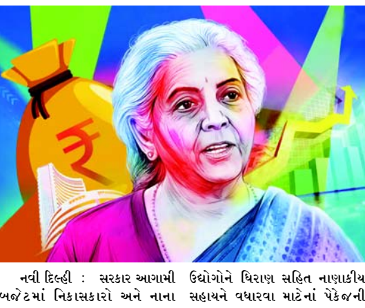
નવી દિલ્હી : સરકાર આગામી ઉદ્યોગોને ધિરાણ સહિત નાણાકીય બજેટમાં નિકાસકારો અને નાના