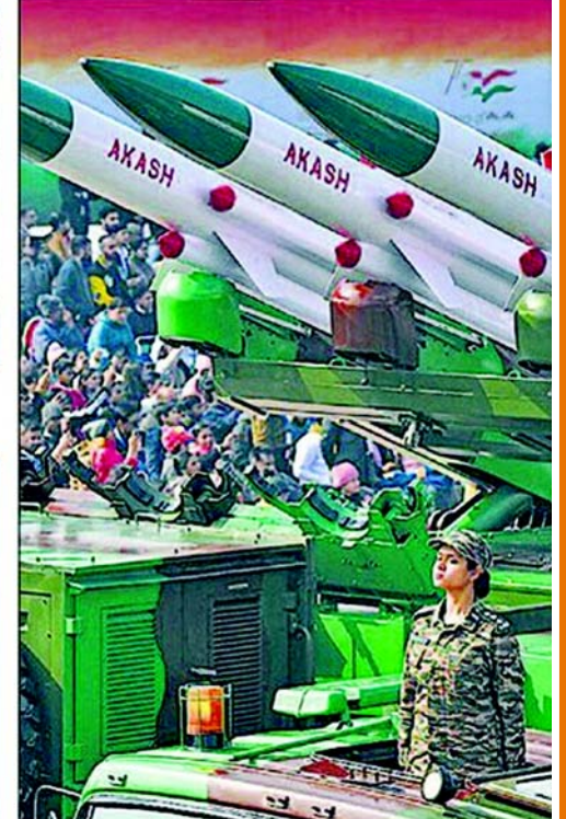
આકાશ આર્મી લોન્ચર સિસ્ટમે દર્શકોનું ધ્યાન ખેંચ્યું હતું.

નવી દિલ્હી : પરેડના ફુલ ડ્રેસ રીહર્સલમાં ભારતીય સેનાનાં જવાનોએ પોતાની તાકાત બતાવી હતી. આ સમયગાળા દરમિયાન ભારતીય વાયુસેનાના વિમાનોએ ઉડાન ભરી હતી. આર્મીની સ્વદેશી મુખ્ય યુદ્ધ ટેન્ક અર્લુન ટેન્ક સહિતનાં આધુનિક હથિયારો પણ જોવા મળ્યાં હતાં. આ વખતે પરેડમાં પ્રથમ વખત, ત્રણેય સેનાની ઝાંખી બતાવવામાં આવશે, જે સશસ્ત્ર દળો વચ્ચેની એકતા દર્શાવે છે. 'સ્ટ્રોંગ એન્ડ સિક્કેશરી ઇન્ડિયા' નામની આ પરેડમાં સ્વદેશી અર્લુન બેટલ ટેન્ક, તેજસ કોમ્પેટ એરક્રાફ્ટ અને અદ્યતન લાઈટ હેલિકોપ્ટર દર્શાવતાં સંકલિત યુદ્ધભૂમિનું પ્રદર્શન કરવામાં આવશે. ભારતીય સેના ટી-૯૦ ભીષ્મ ટેન્ક, બ્રહ્મોસ મિસાઇલ સિસ્ટમ, પિનાકા રોકેટ લોન્ચર અને આકાશ શસ્ત્ર પ્રણાલી સહિત તેની તાકાતનું પ્રદર્શન કરશે.