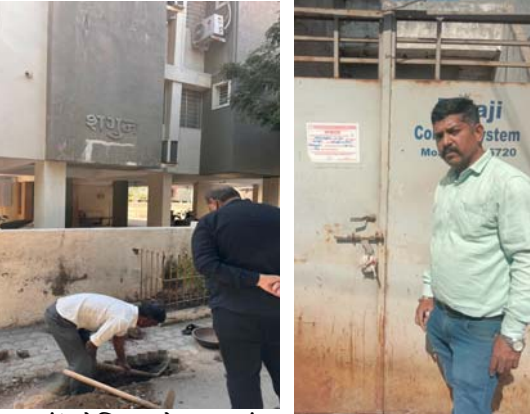
સત્યસાંઈ હોસ્પિટલ રોડ બાજુમાં આસોપાલવ ઘર નં.૯૧, ૯૨માં નળ કનેક્શન કાપતા વેરાના ચેક ઘર માલિકોએ આપી દીધા હતા. યુનિ. રોડના શકિતનગરમાં આવેલ શગુન એપાર્ટમેન્ટમાં પ્રથમ માળે નળ કનેક્શન કાપી નાખવામાં આવ્યું હતું. વોર્ડ નં.૧૩ના ગોંડલ રોડ પર કિસ્કટલ કોમ્પ્લેક્સમાં દુકાન, માલવિયાનગરમાં દોશી હોસ્પિટલ રોડ પર ગાયત્રી કોમ્પ્લેક્સમાં

રાજકોટ, તા. ૨૪ મનપાની વેરા વસુલતા શાખા દ્વારા ચાલતી રીકવરી અને બાકીદારોની મિલકત સીલ કરવાની ઝુંબેશમાં આજે માધાપર, સમ્રાટ, કોઠારીયા રોડના જુદા જુદા ઔદ્યોગિક વિસ્તારોમાં કારખાના સહિતની વધુ ૧૦ મિલકતો સીલ કરવામાં આવેલ હતી. તે કાલાવડ અને યુનિ. રોડ પર રહેણાંક વિસ્તારમાં બાકીદારોના નળ કનેક્શન કાપવામાં આવતા દોડધામ થઈ હતી. રીકવરી ટીમ દ્વારા વોર્ડ નં.૩માં ગાંધી સોસાયટી સામે માધાપર ઈન્ડ. એરીયામાં એક મિલકત સીલ કરાઈ હતી તો બીજી મિલકતમાંથી ૧૦.૮૦ લાખની રીકવરી થઈ હતી. વોર્ડ નં.૪ના ઉચ્ચ પાર્ક અને વોર્ડ નં.૫ના રણછોડનગર સોસાયટીના ફ્લેટમાં સીલની કાર્યવાહી કરતા ચેક જમા થયા હતા. કુલાવડા રોડ જગતલાકાની બાજુમાં એક મિલકતને તાળા મારવામાં આવ્યા હતા. ન્યુ રાજકોટમાં વોર્ડ નં.૧૦માં