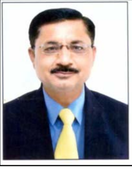
૧૦ના વર્ગો શરૂ કરવા પણ સમિતિએ ઈરાદો જાહેર કર્યો હતો.

રાજકોટ, તા. ૨૪ રાજકોટ મહાનગરપાલિકા સંચાલિત નગર પ્રાથમિક શિક્ષણ સમિતિની બોર્ડ બેઠકમાં સને ૨૦૨૫-૨૬ નું ૨૦૨ કરોડ, ૧૬ લાખનું બજેટ રજૂ કરવામાં આવતા બજેટ સર્વાનુમતે મંજૂર કરવામાં આવેલ છે. બેઠકે કુલ બજેટમાં ૨૦૦ કરોડ જેટલો ખર્ચ શિક્ષકોના પગાર સહિતના મહેકમ અને વહીવટી ખર્ચમાં જાય છે તેમ ઉલ્લેખનીય છે. છતાં ચેરમેન વિક્રમભાઈ પુલજીએ મૂળકા, માધાપર, કોઠારીયા સહિતના વિસ્તારોમાં નવી શાળા નિર્માણ કરવાની જાહેરાત કરી છે. તે ધો. ૮ બાદ આ જ શાળામાં ધો. ૯ અને