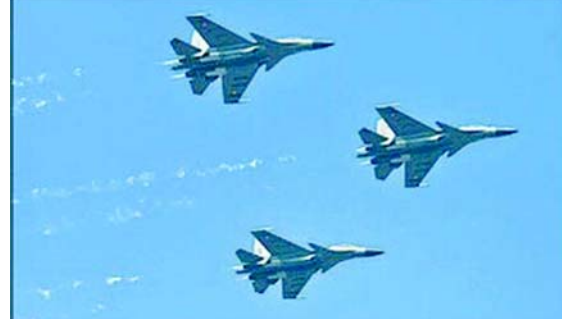
ફુલ ડ્રેસ રીહર્સલ દરમિયાન એરફોર્સ ફાઇટર પ્લેન્સે ઉડાન ભરી હતી.