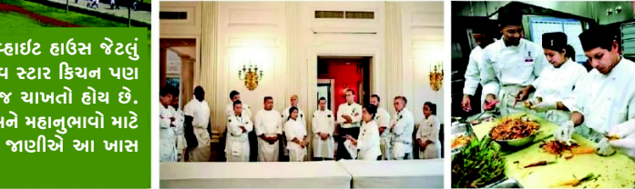
અલગથી છે પેસ્ટ્રી કિચન અને ફેમિલી કિચન :- વ્હાઈટ હાઉસમાં ૧૩૨ રૂમ છે, તેમાં ત્રણ કિચન છે. મુખ્ય રસોડા સાથે, વ્હાઈટ હાઉસના રસોડામાં પેસ્ટ્રીઓથી કામ કરી રહ્યાં છે. હવે વ્હાઈટ હાઉસનું આ રસોડું ડોનાલ્ડ ટ્રમ્પ માટે બંધ બનાવવાની કોશિશ કરશે, જોકે ટ્રમ્પ જ્યારે છેલ્લે વ્હાઈટ હાઉસમાં રહેલાં હતાં ત્યારે તેમને અહીંનું બર્ગર પસંદ નહોતું આથી તેમણે નિયમો તોડીને બહારથી મંગાવવાનું શરૂ કર્યું હતું. આ વખતે જોવાનું રહેશે કે તેમને આ રસોડામાંથી બંધ ફૂડ પસંદ આવે છે કે નહીં.