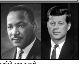
ફાઈલો પણ ખુલશે. પ્રમુખ ડોનાલ્ડ ટ્રમ્પે બહાર કઠુકે લોકો લાંબા સમયથી આ રહસ્યો બાજુવા માટે આતુર છે તેનો અંત આવવો જોઈએ. આ

વોશિંગ્ટન: અમેરિકામાં તત્કાલીન પ્રમુખ અબ્રાહમ લીકન પાટના બે સોથી ચર્ચાસ્પદ હત્યા પુર્વે પ્રમુખ રોબર્ટ એફ કેનેડી તથા માનવ અધિકાર ચળવળના પ્રણેતા માર્ટીન લ્યુથર કિંગ- જૂનીયરની હત્યાની આસપાસના રહસ્યો આગામી દિવસોમાં ખુલાકા થશે. હાલમાં જ અમેરિકાનું સુકાન સંભાળનાર પ્રમુખ ડોનાલ્ડ ટ્રમ્પે આ બંને હત્યાની ફાઈલોને ખુલી કરવાનો આદેશ પર સહી કરી છે અને આગામી જપ દિવસમાં તેને ખુલી કરવા અંગેની તકનીકી નિશ્ચિત થઈ જશે. રોબર્ટ એફ કેનેડી જેઓને અમેરિકાના લોકપ્રિય પ્રમુખના સ્થાન મેળવી ગયા હતા. તેઓની ટેકાસાના તેમના પ્રવાસ સમયે ૨૨ નવે. ૧૯૬૩ના હત્યા કરવામાં આવી હતી અને તેના હત્યારા હાઈવે ઓવરલાઇડ સામે મુકદ્દમા ફાઇલો તે પુર્વે તેની પણ હત્યા થઈ હતી જેથી કેનેડીની હત્યાનું રહસ્ય કાયમ માટે ધખરાઈ ગયું હતું તે માર્ટીન લ્યુથર કિંગની હત્યા ૧૯૬૨માં થઈ હતી તે સંબંધિત પણ