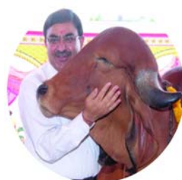
ગરીબો માટે જ નહીં. પરંતુ ગામ માટે પણ આશીર્વાદપુરુષ વધુ જ ગામોમાં ગોચર વિકસિત છે તેવાં ગામોમાં ગાયો આપવાનું કાર્ય કરવામાં આવે તે ચારની સમસ્યા ન રહે અને આર્થિક રીતે ગાય પરવડી શકે.

પૂર્વ કેન્દ્રીય મંત્રી, પૂર્વ અધ્યક્ષ રાષ્ટ્રીય કામધેનુ આયોગ ડો વક્ષભભાઈ કથીરિયા જણાવે છે કે ગાયને હિંદુ ધર્મમાં ખૂબ જ પવિત્ર માનવામાં આવે છે. ગાયને 'લક્ષ્મી' નું સ્વરૂપ માનવામાં આવે છે અને એવું માનવામાં આવે છે કે ગાય ઘરમાં સુખ, સમૃદ્ધિ અને સકારાત્મકતા લાવે છે. ગાયનું રક્ષણ કરવું અને તેની સેવા કરવી એ એક મહાન પુણ્યનું કાર્ય માનવામાં આવે છે. આજે રાજ્યની પાંજરાપોળો- ગૌશાળાઓ વધુ પશુઓના બોલ નીચે દબાઈ રહી છે અને સારાં પશુઓને પણ પાંજરાપોળોમાં રહેવું પડે છે તેવા સંજોગોમાં ગાયને ગૌશાળા, પાંજરાપોળથી ઘરઆંગણા સુધી લાવવાના પ્રયાસ માત્ર ગરીબો માટે જ નહીં. પરંતુ ગામ માટે પણ આશીર્વાદપુરુષ વધુ જ ગામોમાં ગોચર વિકસિત છે તેવાં ગામોમાં ગાયો આપવાનું કાર્ય કરવામાં આવે તે ચારની સમસ્યા ન રહે અને આર્થિક રીતે ગાય પરવડી શકે.