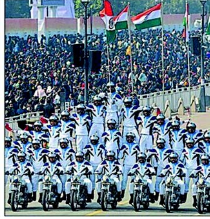
ભારતીય સેનાની કેરેવિલ્સ ટીમે ગુરુવારે પોતાની તાકાત બતાવી. આ ટીમે વર્લ્ડ રેકોર્ડ બનાવીને ઇતિહાસ રચ્યો હતો.