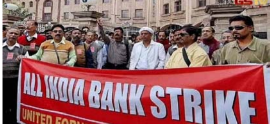
પ્રદર્શનની સમીક્ષા કરવા તેમજ પ્રદર્શન આધારે પ્રોત્સાહન આપવાનો તાબેતરમાં જ નિર્દેશ આપ્યો છે, જેને પરત લેવામાં આવે. આવા નિર્દેશ નોકરીની સુરક્ષા માટે ખતરા સમાન છે અને કર્મચારીઓ વચ્ચે વિભાજન ઉભું કરે છે. યુએફબીયુએ આક્ષેપ કર્યો છે કે, નીતિ વિષયક બાબતોમાં જોડે ક્ષેત્રની

રાજકોટ, તા. ૮ બેંક ખાતાધારકોને માર્ચમાં સતત ચાર દિવસ મુકેલીનો સામનો કરવો પડી શકે છે, કારણ કે બેંક યુનિયનોએ હડતાળની જાહેરાત કરી છે. યુનિયનોએ સમાહના પાંચ દિવસ કામકાજ અને તમામ કેડરમાં પદો ભરતી સહિત વિવિધ માંગો મુકે રાષ્ટ્રવ્યાપી હડતાળની જાહેરાત કરી છે. નવ બેંકોના કર્મચારી સંઘોના સંયુક્ત સંગઠન યુનાઈટેડ ફોર એન્ડ બેંક યુનિયન્સની હડતાળના ઉદ્દેશ્યમાં જોડે ક્ષેત્રની બેંકોમાં કર્મચારી-અધિકારી નિર્દેશકોની ભરતી કરવાની પણ માંગ છે. સંગઠને નિવેદનમાં કહ્યું છે કે, 'અમે યોગ્ય ચર્ચા-વિચારણા કર્યા બાદ ૨૪ અને ૨૫ માર્ચ સતત બે દિવસ હડતાળ સાથે આંદોલન કાર્યક્રમ ચોલવાનો નિર્ણય લીધો છે. નાણાકીય સેવા વિભાગે