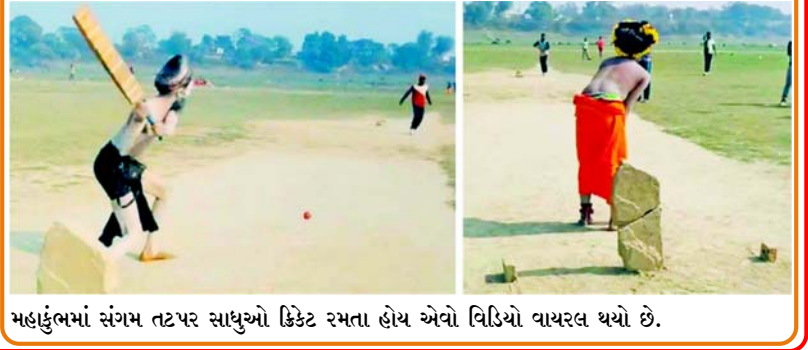
મહાકુંભમાં સંગમ તટ પર સાધુઓ ક્રિકેટ રમતા હોય એવો વિડિયો વાયરલ થયો છે.