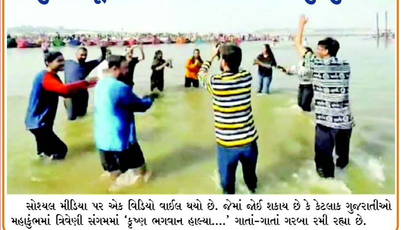
સોશલ મીડિયા પર એક વિડિયો વાઈલ થયો છે. જેમાં ભોઈ શકાય છે કે કેટલાક ગુજરાતીઓ મહાકુંભમાં ત્રિવેણી સંગમમાં 'કૃષ્ણ ભગવાન હાલ્યા....' ગાતાં-ગાતાં ગરબા રમી રહ્યા છે.

કેટલો ખર્ચ થશે? સમગ્ર કેટલો ખર્ચ ૩૫,૦૦૦ રૂપિયા પ્રતિ વ્યક્તિ હશે, જેના માધ્યમથી શ્રદ્ધાળુ સંગમમાં ચાલ્યા વગર જ સીધા પહોંચીને સ્નાન કરી શકશે. ખાસ કરીને વૃદ્ધો અને દિવ્યાંગો માટે સંગમ પહોંચવું ખૂબ જ મુશ્કેલ બની ગયું છે. અંધી આ પધ્ધતિ ખૂબ જ સુલભ અને સરળ હશે. હાલ ઘણા લોકો હેલિકોપ્ટર સર્વિસનો ઉપયોગ કરી રહ્યા છે અને સંગમમાં સ્નાન કરીને ધન્યતા અનુભવી રહ્યા છે. રાઈડસ સતત ચાલી રહી છે. તમે ઇચ્છો તો ૪-૫ કલાકમાં જ સંગમમાં સ્નાન કરીને પરત ફરી શકો છો. ૩૫,૦૦૦ રૂપિયામાં એરપોર્ટથી સંગમ સુધીની તમામ જવાબદારી કંપની દ્વારા ઉઠાવાઈ રહી છે.