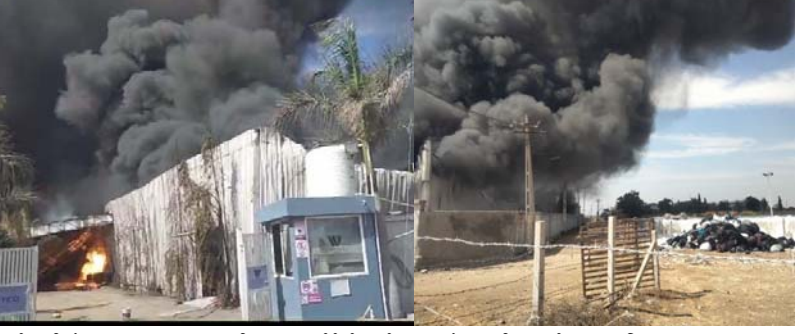
ફેક્ટરીમાં આગ લાગતા દૂર દૂર સુધી ધુમાડાના ગોટ્ટોટો જોવા મળ્યાં ગાદલા બનાવતી ફેક્ટરીમાં આગ : લાખોનું નુકસાન બેડી (વાછકપર) ગામે ફેક્ટરી આવેલ છે, ફાયર બ્રિગેડ દોડી ગયું છે. આગનું કારણ લાજી શકાયું નથી. કોટન અને ફેબ્રિકાના ગાદલા બનાવતી કંપની હોય, આગે વિકરણ રૂપ લીધું હતું. દૂર દૂર સુધી ધુમાડાના ગોટ્ટોટો જોવા મળ્યાં વોર્થ વિલ લિમિટેડ હોવાનું જાણવા મળ્યું હતું.

સોસાયટીઓમાં મેટલીંગ તથા પેવર કામ કરવામાં આવશે. જ્યારે નવી બનેલી ૩૦થી વધુ સોસાયટીઓમાં પ્રથમ મેટલીંગ કામ કરી નવા રોડ બનાવવામાં આવશે. છ વોર્ડમાં સોસાયટીઓ તેમજ મુખ્યમાર્ગો સિવાય સોપાડા ચોકડીથી કુવાડવા તરફ જતાં રોડનું નવીનીકરણ કરવામાં આવશે. હાલ આ રસ્તો જર્જરીત હાલતમાં છે. રૂ. ૯.૧૨ કરોડના ખર્ચે સોપાડા ચોકડીથી કુવાડવા રોડ સુધીનો નવો ડામર રોડ બનાવવા કાર્યવાહી શરૂ કરવામાં આવી છે. આ રીતે હવે બે મહિનામાં શક્ય એટલા વધુ કામોના વર્ક ઓર્ડર આપી દેવા પદાધિકારીઓએ સૂચના આપી છે.