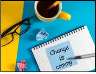
અલગ અલગ અને ગુંચવણભરી જોગવાઈઓ લાગુ પડે છે તેના બદલે મોટા ભાગની

સમગ્ર કાનૂનમાં જટીલતા, બેવડા અર્થઘટન, વિરોધાભાસી જોગવાઈ દુર કરી અત્યંત સરળ કાનૂન તૈયાર: સંસદમાં રજૂ કરાશે