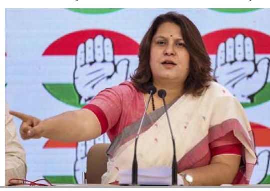
આ ચૂંટણીમાં ‘આપ’ના વિજયની જવાબદારી લીધી ન હતી. અમારો ધ્યેય તેમણે કહ્યું કે અરવિંદ કેજરીવાલ ગોવા, હરીયાણા, ઉત્તરાખંડ, ગુજરાત તમામ રાજ્યોમાં કોંગ્રેસ સામે ચૂંટણી લડવા ગયા હતા અને ત્યાં ભાજપ જીત્યું છે. ત્યારે અમે આમ આદમી પાર્ટીને જવાબદાર ગણાવી ન હતી. કોંગ્રેસ સતત ત્રીજી વખત એક પણ બેઠક જીતવામાં સફળ રહી નથી. પ્રાથમિક ચિત્ર મુજબ ભાજપ અને આદમી પાર્ટીની ટકકરમાં કોંગ્રેસને

નવી દિલ્હી, તા. ૮ પાટનગર દિલ્હીની પ્રતિષ્ઠાભરી વિધાનસભા ચૂંટણીમાં ઈન્ડિયા ગઠબંધનના બે સાથી પક્ષો કોંગ્રેસ અને આમ આદમી પાર્ટી સામે સામે લડ્યા અને તેમાં ભાજપે પ્રચંડ જીત મેળવ્યા બાદ કોંગ્રેસ પોતાના ધબકકા માટે જવાબદારી સ્વીકારી પરંતુ ‘આપ’ના પરાજય માટે કોંગ્રેસ જવાબદાર નથી. તેનું વિધાન કર્યું છે. પક્ષના પ્રકટતા સુપ્રિય સુનેરી એક વાતચીતમાં કહ્યું કે ૧૫ વર્ષ આ રાજ્યમાં અમારું શાસન હતું પણ અમે