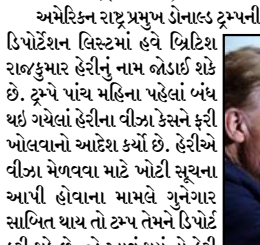
વોશિંગ્ટન, (અમેરિકા) તા. ૮ અમેરિકન રાષ્ટ્રપ્રમુખ ડોનાલ્ડ ટ્રમ્પની ઈન્ડિવિડ્યુઅલ હશે. ટ્રમ્પે પહેલાં જ કહી દીધું છે કે, હેરી અને તેમની પત્ની મેગન ડિપોર્ટશન લિસ્ટમાં હવે બ્રિટીશ રાજકુમાર હેરીનું નામ બોડાઈ થશે છે. ટ્રમ્પે પાંચ મહિના પહેલાં બંધ થઈ ગયેલાં હેરીના વીઝા કેસને ફરી ખોલવાનો આદેશ કર્યો છે. હેરીએ વીઝા મેળવવા માટે ખોટી સૂચના આપી હોવાના મામલે ગુનેગાર સાબિત થાય તો ટ્રમ્પ તેમને ડિપોર્ટ કરી શકે છે. જો આવું થયું તો હેરી ટ્રમ્પના કાર્યકાળમાં ડિપોર્ટ થનારા પહેલાં

મહેલને કોઈ છૂટ નહીં આપવામાં આવે. કોર્ટ દીધી છે. આ મામલો હેરીની આત્મકથા 'સપેયર' સાથે બોડાયેલો છે. જેમાં તેમણે કિશોરાવસ્થામાં ડ્રગ્સ લેવાની કબજાત કરી હતી. હેરીએ અમેરિકાના વીઝા લેવા સમયે આ વાત છુપાવી હતી. આ મુદ્દો બનાતના સાથે જ દક્ષિણપશ્ચીમ સંબંધન હેરિટેજ ફાઉન્ડેશનને તેમનો કેસ ફરી ખોલવાની અરજ દાખલ કરી દીધી છે.