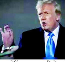
વોશિંગ્ટન : રાષ્ટ્રપતિ ડોનાલ્ડ ટ્રમ્પે શુક્રવારે કહ્યું હતું કે તેઓ આપતા અને સવારના તાપમાનમાં વધારો થયો હતો. તેમણે કહ્યું કે આ વધારાનો ટેરિફ દેશની બજેટ ખાતે ભરવામાં મદદ કરી શકે છે. ટ્રમ્પે કહ્યું ન હતું કે કયા દેશો પર તે ટેરિફ લગાવશે પરંતુ તેમણે સંકેત આપ્યો કે તે એક વ્યાપક પ્રયાસ હશે જે યુ.એસ. બજેટની સમસ્યાઓ હલ કરવામાં પણ મદદ કરી શકે. આ પગલું ટ્રમ્પના ચૂંટણી

વચનને પૂર્ણ કરશે જેમાં અમેરિકન આયાત પર ટેરિફ લાદવામાં આવશે, જે વ્યવસાયિક ભાગીદાર દેશોએ અમેરિકન નિકાસ પર મુકતા ટેરિફની ખરાબર હશે. ટ્રમ્પ અને તેના ટોચના સહીઓએ કહ્યું છે કે તેઓ ટ્રમ્પના ૨૦૧૭ ના કર ઘટાડાને વધારવા માટે વિદેશી આયાત પર ઉચ્ચ ટેરિફનો ઉપયોગ કરવાની મોજબા બનાવી રહ્યાં છે, જે યુ.એસ.ના