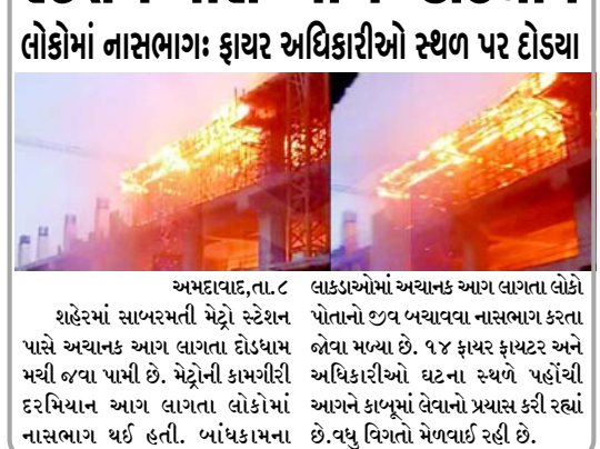
અમદાવાદ, તા. ૮ શહેરમાં સાબરમતી મેટ્રો સ્ટેશન પાસે અચાનક આગ લાગતા દોડધામ મથી જવા પામી છે. મેટ્રોની કામગીરી દરમિયાન આગ લાગતા લોકોમાં નાસભાગ થઈ હતી. બાંધકામના