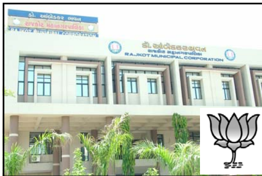
સંકલન કરવામાં આવ્યું છે. ચાલુ નાણાકીય વર્ષનું બજેટ ૬૫

મિટીંગ બોલાવવામાં આવી હતી જેમાં નીતિ નક્કી કરી લેવામાં આવી છે. હવે આવતા સમાહના પ્રારંભે શાસકો બજેટ મંજૂર કરશે જેમાં કેટલીક લોકોને લાગુ પડતી નવી ચોલના પણ જોડવામાં આવે તેવા નિર્દેશ છે. રાજકોટ મહાપાલિકાના બજેટમાં નવો ૫૫ કરોડનો ફાયર ટેક્સ, ગાર્બેજ કલેક્શનમાં ૫૫ કરોડ અને મિલકત વેરામાં ૪૦ કરોડનો વેરો વધારવા ભલામણ કરવામાં આવી છે. પરંતુ મેયર બંગલે મળેલી સંકલનમાં ચૂંટણી વર્ષમાં પ્રજા પર આવો કોઈ ફરબોજ ન વધારવા નિર્ણય મળ્યું છે. આ અંગે પ્રેક્ષ ભાગ્યે સુધી