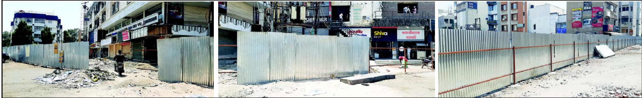
સર્વેશ્વર ચોકમાં વોંકળા દુર્ઘટના બાદ શિવમ બિલ્ડિંગને સીલ મારી દેવામાં આવ્યા હતા. સલામતી ખાતર આજ સુધી આ બંને યુનિટ સીલ છે ત્યારે હવે ચૂંટણી પરિણામો બાદ આ કોમર્શિયલ કોમ્પ્લેક્સ ખુલે અને પતરા હટાવે તેવી આસામીઓને આશા છે.

રાજકોટમાં ગરમીનો પારો વધતા લોકોને ભારે હાલાકી પડી રહી છે. છેલ્લા એક સપ્તાહથી કાળજાળ ગરમી પડી રહી છે. લોકો ગરમીથી એટલા ત્રસ્ત થઈ ગયા છે કે ઘરની બહાર નીકળવાનું ટાળી રહ્યા છે. તેમાં પણ ઘરની બહાર નીકળવા બાદ આકર તાપમાં ઉભું રહેવું પણ ખુબ મુશ્કેલીભર્યું રહે છે. ત્યારે આવા ધગધગતા તાપમાં રાજકોટના રસ્તાઓ પર નીકળતા રાહદારીઓ માટે તંત્ર દ્વારા ખાસ વ્યવસ્થા ગોઠવવામાં આવી છે. રાજકોટના અનેક ટ્રાફિક સિગ્નલ પર મંડપ બાંધવામાં આવ્યા છે. જેથી ટ્રાફિક સીગ્નલ સમયે ઉભા રહેતા વખતે લોકો છાયામાં ઉભી રહી શકે અને રાહત મેળવી શકે ત્યારે આજરોજ પારવડી ચોક, ગ્રીનલેન્ડ ચોકડી ખાતે આવેલ ટ્રાફિક સીગ્નલ બાંધવામાં આવ્યો છે. આ વ્યવસ્થાની લોકોએ રાહત મેળવી હતી.