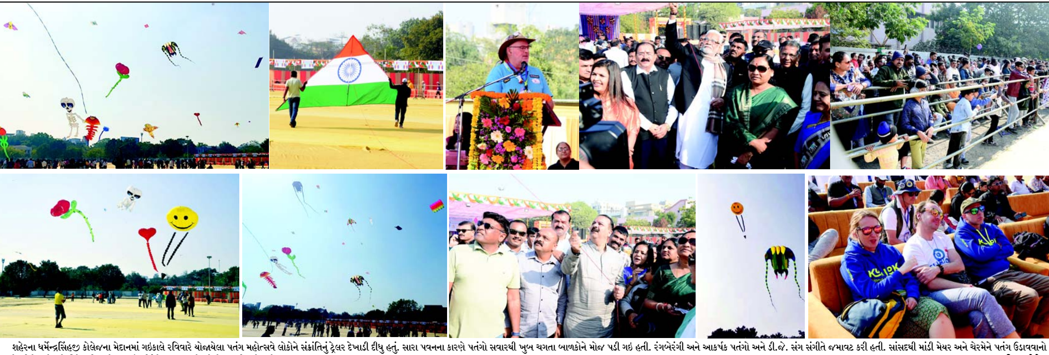
શહેરના ધર્મેન્દ્રસિંહજી કોલેજના મેદાનમાં ગઈકાલે રવિવારે યોજાયેલા પતંગ મહોત્સવે લોકોને સંક્રાંતિનું ટૂંકા દેખાડી દીધું હતું. સારા પવનના કારણે પતંગો સવારથી ખુબ ચગતા બાળકોને મોજ પડી ગઈ હતી. રંગબેરંગી અને આકર્ષક પતંગો અને ડી.જે. સંગ સંગીતે જમાવટ કરી હતી. સાંસદથી માંડી મેયર અને ચેરમેને પતંગ ઉડાવવાનો હવાવો લીધો હતો. તો વિદેશથી આવેલા પતંગવીરોને પણ રાજકોટનો પ્રેમ ગમી ગયો હતો.