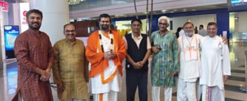
૧૯ જાન્યુઆરી દરમિયાન મસ્કત, દુબઈ, શારજહા તથા બર દુબઈ ખાતે સત્સંગ - વચનામૃત - શ્રીકૃષ્ણ ધ્યાન જેવા આધ્યાત્મિક આયોજનો પૂજ્ય મહારાજના સાનિધ્યમાં સંપન્ન થશે. ગલ્ફ દેશોમાં વસતા ભારતીય સમુદાયના ધર્મપ્રેમીઓને મોટી સંખ્યામાં આ અલોકિક આયોજનોથી લાભાન્વિત બનશે.