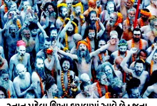
સ્નાન પહેલા શિખા કાપવામાં આવે છે : જુના, નિરંજની અને મહાનિર્વાણી અખાડાઓએ નાગા બનાવવાની તૈયારીઓ શરૂ કરી

જુના, નિરંજની અને મહાનિર્વાણી અખાડાઓએ નાગા બનાવવાની તૈયારીઓ શરૂ કરી નાગા બનાવવા માટે સક્ષમ છે. આ પછી તેને નાગા સંન્યાસી બનાવવામાં આવશે. મૌની અમાવસ્થામાં સ્નાન કરતાં પહેલાં, ગુરુ સવારે ૪ વાગ્યે તેમનાં આખા વાળ કાપી નાખશે. જ્યારે અખાડાઓ મૌની અમાવસ્થા સ્નાન માટે જાય છે, ત્યારે તેઓને પણ અન્ય નાગો સાથે સ્નાન કરવા મોકલવામાં આવે છે. જુના, નિરંજની અને મહાનિર્વાણી અખાડાઓએ નાગા બનાવવાની તૈયારીઓ શરૂ કરી નાગા બનાવવા માટે સક્ષમ છે. આ પછી તેને નાગા સંન્યાસી બનાવવામાં આવશે. મૌની અમાવસ્થામાં સ્નાન કરતાં પહેલાં, ગુરુ સવારે ૪ વાગ્યે તેમનાં આખા વાળ કાપી નાખશે. જ્યારે અખાડાઓ મૌની અમાવસ્થા સ્નાન માટે જાય છે, ત્યારે તેઓને પણ અન્ય નાગો સાથે સ્નાન કરવા મોકલવામાં આવે છે.