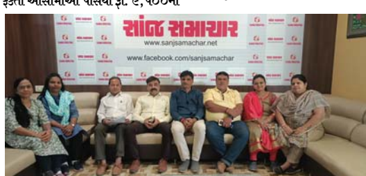
રાજકોટ, તા. ૧૫ સૌરાષ્ટ્ર યુનિ. દ્વારા આયોજીત કચ્છા અભિયાનના ૧૬ કંટ્રોલ રૂમ કાર્યરત: પતંગની દોરીના ગુરુણ જમા કરાવનારને આપશે રૂ.૧૫૧૧નું પુરસ્કાર

રાજકોટ, તા. ૧૫ મહાપાલિકાની સોલીડ વેસ્ટ મેનેજમેન્ટ શાખા દ્વારા પતંગ બજારો સહિતના વિસ્તારોમાંથી વધુ ૩૯ ઘંઘાર્થી પાસેથી પ્રતિબંધિત પ્લાસ્ટિકનો જથ્થો જમ કરવામાં આવ્યો હતો. ખાણીપીણી બજારમાં પણ પાસંલમાં વપરાતું પ્લાસ્ટિક જમ કરાયું હતું. સેન્ટ્રલ ઝોનના જુદા જુદા સ્ટેન્ડથી ૧૬, વેસ્ટ ઝોનમાં ૮ અને ઈસ્ટ ઝોનમાં ૧૫ ઘંઘાર્થી પાસેથી આ પ્લાસ્ટિક પકડાયું હતું. ઝબલા, કોથળીઓ સહિતનો માલ પણ અમુક દુકાનમાંથી જમ કરવામાં આવ્યો હતો તો જાહેરમાં કચરો અને ગંદકી ફેંકતા આસામીઓ પાસેથી રૂ. ૯,૫૦૦નો દંડ વસુલ કરવામાં આવ્યો હતો.