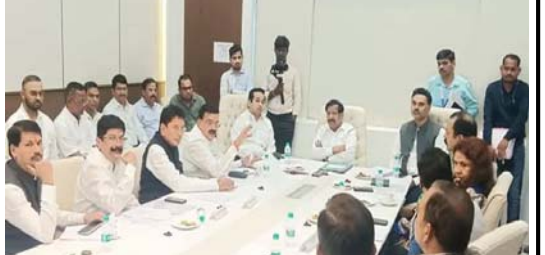
વિનાયક રાઉટ અને ઉદ્ધવ ઠાકરેના નજીકના સંબંધ કદમ પણ હાલત હતાં. બાધવે કહ્યું, ‘આપણે ખોટાં નિર્ણયો પર વિચાર કરવો પડશે અને આગામી પ્રક્રિયા શ્રેષ્ઠ કરવી પડશે.’

મુંબઈ, તા. ૧૫ મહારાષ્ટ્ર વિધાનસભા ચૂંટણીમાં હાર બાદ શિવસેના યુબીટીની સામે નવો પડકાર ઊભો થઈ રહ્યો છે. નેતા ખુશા મંથરી પાર્ટીના કાર્યકર્તા ટીકા કરી રહ્યાં છે. તાબેતરમાં જ એક વરિષ્ઠ નેતા અને ધારાસભ્યએ શિવસેના યુબીટીની તુલના ‘કોંગ્રેસની હાલત’થી કરી દીધી. ધારાસભ્ય ભાસ્કર બાધવે પાર્ટીના કામ કરવાની રીત પર સવાલો ઉઠાવ્યા : રાઉટ-જાધવના સવાલોથી નારાજ