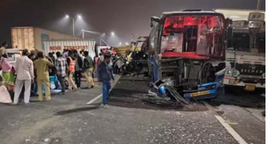
ઓટો-રિક્ષા ચાલક સહિત અન્ય ૧૫ લોકો ઘાયલ થયાં હતાં. માહિતી મળ્યાં બાદ સ્થાનિક પોલીસ અને ઈમરજન્સી રિસ્પોન્સ ટીમ ઘટનાસ્થળે પહોંચી ગઈ હતી. ઘાયલોને શાહપુરની ઉપ-હોસ્પિટલમાં દાખલ કરવામાં આવ્યાં છે અને તેમાંથી ત્રણની હાલત ગંભીર હોવાનું કહેવાય છે, એમ અધિકારીએ જણાવ્યું હતું. પોલીસે જણાવ્યું કે, મુદત્તેલોને પોસ્ટમોર્ટમ માટે સરકારી હોસ્પિટલમાં મોકલવામાં આવ્યાં છે.

થાણે : મહારાષ્ટ્રમાં થાણે જિલ્લામાં આજે સવારે હાઈવે પર એક ઓટો રિક્ષા બસ અને કેટલાક અન્ય વાહનો સાથે અથડાતાં ત્રણ લોકોનાં મોત થયાં હતાં અને ૧૫ લોકો ઘાયલ થયાં હતાં. પોલીસે જણાવ્યું કે મુંબઈ-આગ્રા હાઈવે પર શાહપુર તાલુકાના ગોધેધર ગામમાં ખડાવલી પુલ નજીક સવારે ૪:૧૫ વાગ્યે આ અકસ્માત થયો હતો. ઓટો રિક્ષા ચાલકે કાબુ ગુમાવી દીધો હતો. પરિણામે, વાહન રોડ ઉપર ડાહડર સાથે અથડાયું, લેનમાંથી બહાર નીકળી ગયું અને વિરુદ્ધ દિશામાંથી આવતી એક ખાનગી લકઝરી બસ, બે કાર અને એક ટેમ્પો સાથે અથડાયું હતું. તેમણે કહ્યું કે બસમાં મુસાફરી કરી રહેલાં ત્રણ લોકોનાં ઘટનાસ્થળે જ મોત થયાં હતાં અને