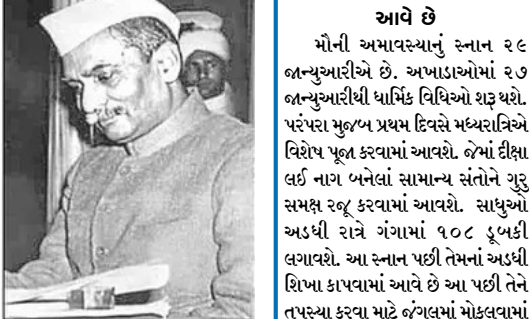
રાષ્ટ્રપતિ રાજેન્દ્ર પ્રસાદે કિદાની બાલકનીમાં

રાષ્ટ્રપતિએ કુંભમાં રહેવાની ઈચ્છા વ્યક્ત કરતાં સેના દ્વારા નિયંત્રિત કિદાની તેમનાં માટે વ્યવસ્થા કરવામાં આવી નવી દિલ્લી : દેશની આઝાદી પછી પ્રથમ કુંભનું આયોજન વર્ષ ૧૯૫૪માં પ્રયાગરાજમાં કરવામાં આવ્યું હતું. કેન્દ્ર અને રાજ્ય સરકારોએ ખાસ વ્યવસ્થા કરી હતી. પ્રથમ રાષ્ટ્રપતિ ડો. રાજેન્દ્ર પ્રસાદે આખા મહિના માટે કલ્પવાસ માટે કુંભમાં આવ્યાં હતાં. આની પાછળ તેમની ધાર્મિક આસ્યા હતી. ધર્મને અનુસરીને તેમણે સૂર્યોદય પહેલાં ભગવં, દરરોજ ત્રણ વખત સ્નાન કરવું, દિવસમાં એકવાર ભોજન કરવું, ત્રિકાલ પૂજા, તુલસી પૂજન, દાન વગેરે નિયમોનું પાલન કર્યું હતું. જ્યારે રાષ્ટ્રપતિએ કુંભમાં રહેવાની ઈચ્છા વ્યક્ત કરી ત્યારે તેમનાં માટે સેના દ્વારા નિયંત્રિત કિદામાં વ્યવસ્થા કરવામાં આવી હતી. આ કિદા સંગમ વિસ્તારમાં યમુના કિનારે આવેલો છે. તત્કાલીન વડા પ્રધાન પંડિત જવાહરલાલ નેહરુ અને ઉત્તર પ્રદેશનાં પ્રથમ મુખ્ય પ્રધાન પંડિત ગોવિંદ બલ્લાભ પંતે વ્યક્તિગત રીતે વહીવટી વ્યવસ્થાનું નિરીક્ષણ કર્યું હતું. રાષ્ટ્રપતિએ કિદાની અંદરથી જ મુખ્ય સ્નાન ઉત્સવો પર સંતો અને સ્ત્રિઓના શાહી સ્નાનના દર્શન કર્યા હતા. પત્રકાર નરેશ મિશ્રાએ બીબીસીને આપેલાં ઈન્ટરવ્યુમાં આ વાતની પુષ્ટિ કરી હતી. વાતની પુષ્ટિ કરી હતી. વાતની પુષ્ટિ કરી હતી. વાતની પુષ્ટિ કરી હતી.