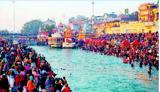
ખાસ મહત્વ છે. મકર સંક્રાંતિનાં દિવસે શ્રદ્ધાળુઓ ગંગાના સ્નાન કરવાથી આત્માને શાંતિ મળે છે. પવિત્રતાનો અનુભવ થાય છે.

અયોધ્યા/હરિદ્વાર તા.૧૫ મકર સંક્રાંતિનાં પ્રથમ સ્નાન માટે દેશભરમાંથી શ્રદ્ધાળુઓ ધર્મનગરી હરિદ્વાર અને અયોધ્યામાં પહોંચી નદીમાં ડુબકી લગાવી હતી. અયોધ્યામાં શ્રદ્ધાળુઓએ સરયુમાં સ્નાન કર્યું હતું. અને હરિદ્વારમાં ગંગામાં ડુબકી લગાવી હતી.